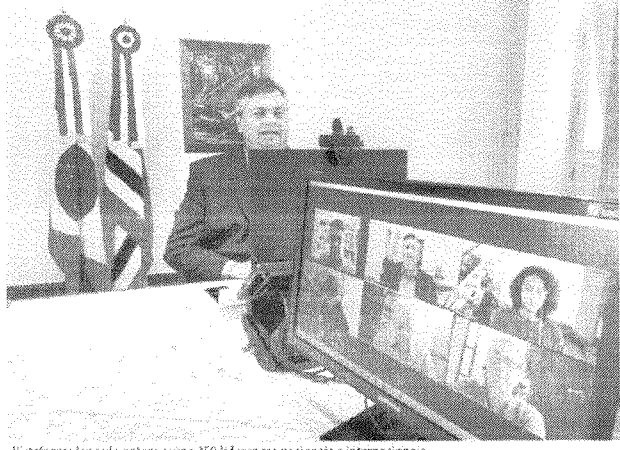
Plataforma lançada ontem reúne 250 lideranças nacionais e internacionais

O governador Flávio Dino participou na manhã desta quinta-feira (24) da 15ª reunião do Conselho Nacional de Lideranças da Amazônia Legal em Manaus. Uma plataforma inédita que reúne 250 líderes locais, nacionais e internacionais que trabalham e desejam contribuir para o desenvolvimento sustentável da região. Atualizada em temas como ciência e tecnologia, demografia, desenvolvimento social, educação e saúde, a plataforma desenvolve pesquisas, análises, levantamentos e estudos que servem de subsídios para a tomada de decisões por parte dos governantes. Os dados podem ser consultados por meio digital e também impressos em papel. A plataforma também oferece um aplicativo para smartphones que permite consultar os dados em qualquer lugar. Os dados podem ser consultados por meio digital e também impressos em papel. A plataforma também oferece um aplicativo para smartphones que permite consultar os dados em qualquer lugar.